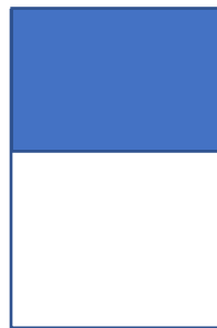
Halbe Innenseite 200 x 150 mm