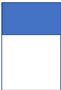
Drittel Innenseite 200 x 100 mm